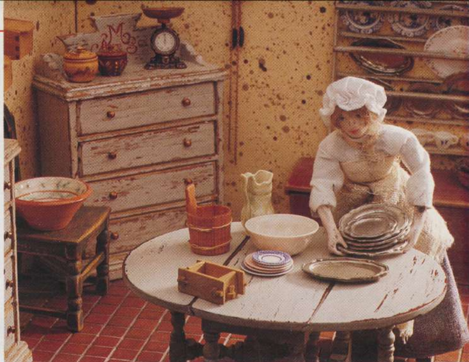
Köksbestyr och köksattiraljer är förbluffande verklighetstroga. Här finns kryddskåp med smörkärna i trä, laggkärl och måttsatser och skeppor för salt och kryddor.