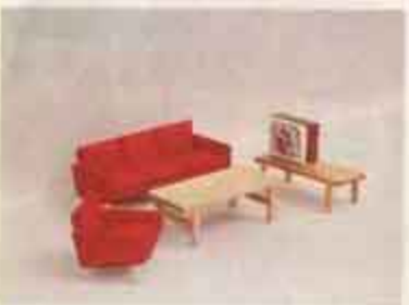
9510 Soffgrupp, skinn — 5111 soffbord, 5148 soffa, 5158 fätölj, 5194 TV + TV-bänk.