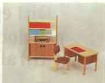
9512 Bibliotek — 5412 skrivbord + stol, 5492 radio, 8460 bokskåp.