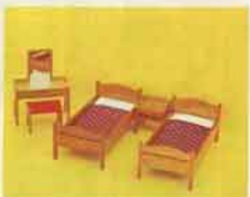
9730 Sovrum, mahogny — 7102 nattbord, 7114 toalettbord + pall, 7262 enkelsäng.