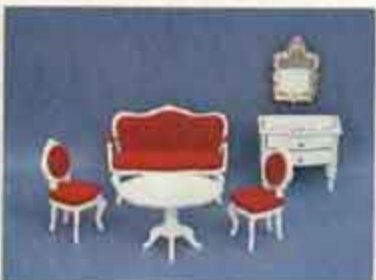
9414 Salong Theräe — 4250 soffbord, 4260 stol, 4270 soffa, 4325 byrå, 6853 spegel.