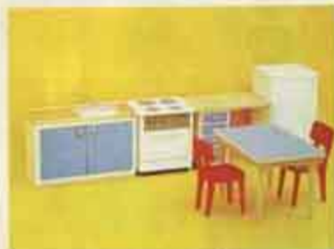
9272 Köksmöbel med kyl — 2501 köksbord + 2 stolar, 2530 köksspis, 2540 diskbänk, 2583 kylskåp.