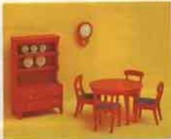
Nyhet 9305 Matsal, röd allmog — 3115 bord + 2 stolar, 3125 stol, 3135 väggur, 3185 skåp.