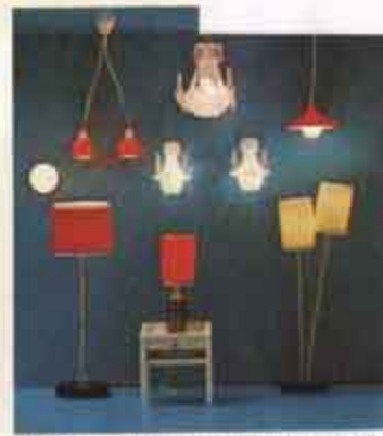
6152 Golvlampa, 10ft stiel, 6164 Bordslampa, rätad, målarig, 6154 Golvlampa, basstaklampa, 6121 Kökslampa, 6132 Taklampa, dubbel, 6143 Kristalllampetter, 6142 Kalkskåp, 6122 Taklampa, vit.