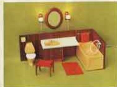
9887 Badrum, m. lampetter — 8837 wc-stol + handduksvägg, 8838 inbyggt tvättställ + spegel, 8839 badkar + matta, 6178 spegellampetter 9886 Badrum = 9887 utan 6178 spegellampetter