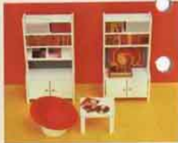
Nyhet 9540 Studio Stereo — 5313 lampbord, 5382 bokhylla, 5383 d.o med tidskriftshylla, 5455 POP-fåtölj, 5493 skivspelare.