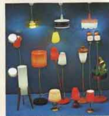
6155 Golvlampa, 3 ben, 6151 Golvlampa, enkel, 6162 Bordslampa, glasbål, 6153 Golvlampa, dubbel, 6151 Bordslampa, trikel, 6156 Aftonljukt, 6163 Bordslampa, ett stiel, 6167 Blombord med lampor, 6173 Lampett, 10ft stiel, 6131 Taklampa, massal, 6171 Lampett, gul, 6133 Taklampa, vitbål, 6177 Taklampa, svart, 6178 Spegellampetter.

Lundy har även ett antal Lundy-Elektro 6050, för i och för sig ledningsnät. Montering ritigen.