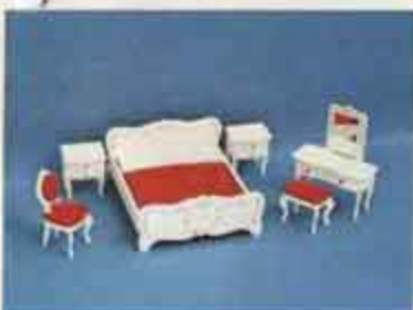
9770 Sovrum, rokok — 4260 stol, 4321 dubbelsäng, 4323 toalettbord + pall, 4324 nattbord.