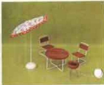
9801 Trädgårdsmöbel — 8613 trädgårdsbord + 2 stolar, 8614 parasoll, 6179 grill.