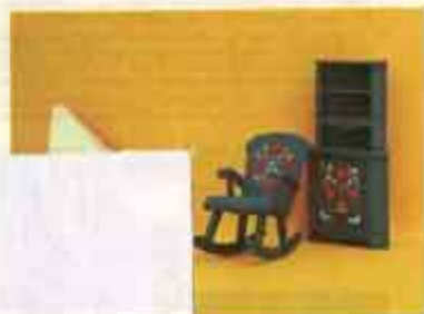
Nyhet 9520 Möbel Leksand — 4329 gungstol, 4453 hörnskåp, 5515 öppen spis, 5772 vedkorg.