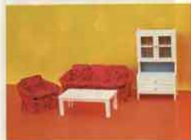
Nyhet 9530 Salong Romance — 5310 soffbord, 5340 soffa, 5350 fåtölj, 5381 vitrinskåp.