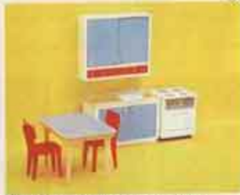
9250 Köksmöbel med skåp — 2501 köksbord + 2 stolar, 2530 köksspis, 2540 diskbänk, 2550 köksskåp, 9270 Köksmöbel = 9250 utan 2550.