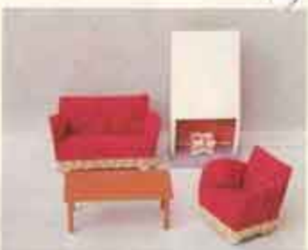
9502 Soffgrupp med spis — 5200 fätölj, 5210 soffa, 5773 öppen spis.