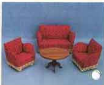
9500 Soffgrupp, stoppad — 5200 fätölj, 5210 soffa, 5250 soffbord.