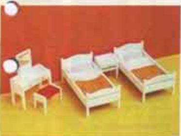
9710 Sängkammare, vit — 7103 natt- bord, 7115 toalettbord + pall, 7263 enkelsäng, bäddad.