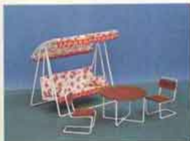
9802 Hammockmöbel — 8613 trädgårdsbord + 2 stolar, 8647 hammock.