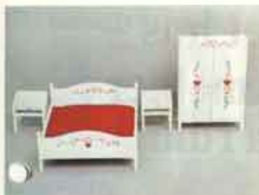
9790 Sovrum, allmogedekor — 7103 nattbord, 7163 dubbelsäng, 7184 klädekap.