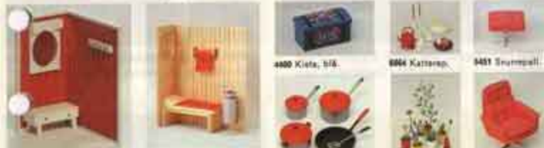
8190 Häll, hylla, spegel, 8888 Bada med lampor, 8400 Kieta, bisk, 8884 Katterop, 8451 Snurreball, 8885 Koka-set, 8823 8 blommor, 8460 Snurrestolj.