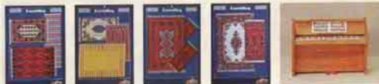
8381 Mattor Christina — 8201 Isamatta, 8223 Ijust Orient, 8291 ryk, 84, 8382 Mattor Desiné — 8211 matta, gul, 8232 ryk Desiné, 8283 Mattor Balkan — 8225 Salons, 8384 Mattor Bagdad — 8223 Kemlar, 8224 Bagdad, 8890 Piano i pell.