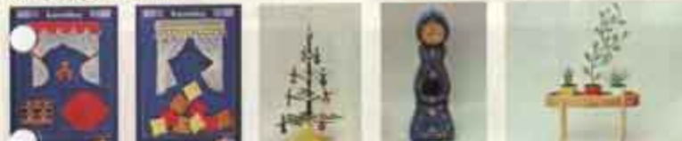
8330 Gardinet, blå, 8330 Gardinet, varlagrum, 8886 Julgran, 4415 Morsklöcka, blå, 8883 Blombord.