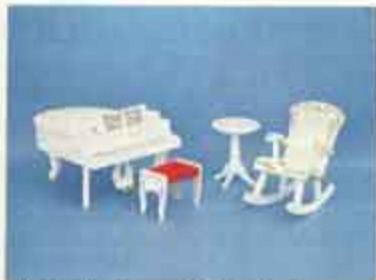
9419 Musiksalong — 4113 pelarbord, 4318 flygel + pall, 4327 gungastol.