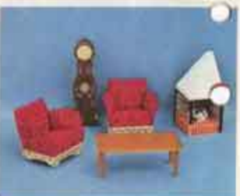
9501 Fätöljgrupp med spis — 3430 golvur, 5200 fätölj, 5515 öppen spis.