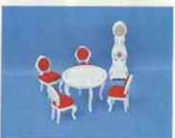
9404 Matsal Dinée — 4260 stol, 4313 bord + 2 stolar, 4315 moraklocka.