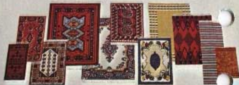
Exempel ur Lundby mattkollektion: Finns både styckvis och i större förpackningar.

Kartongförpackningar: 9302 Bord med två Stolar 3013, Buffé 3081, två Malstolar 3022, Väggur 3830. 9510 Soffa 5148, Fåtölj 5158, Soffbord 5111, TV med Bänk 5194, Småförpackning: 5094 Piano med Pall.