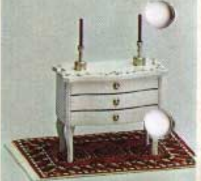
Rokokobyrå 4325. Orientalisk matta 6221.