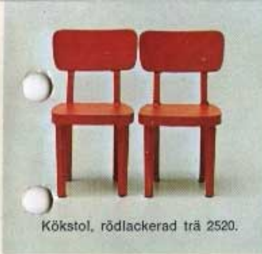
Kökstol, rödlackerad trä 2520.