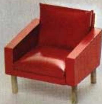
Fåtölj, stoppad skinnimiterad klädsel 5158.