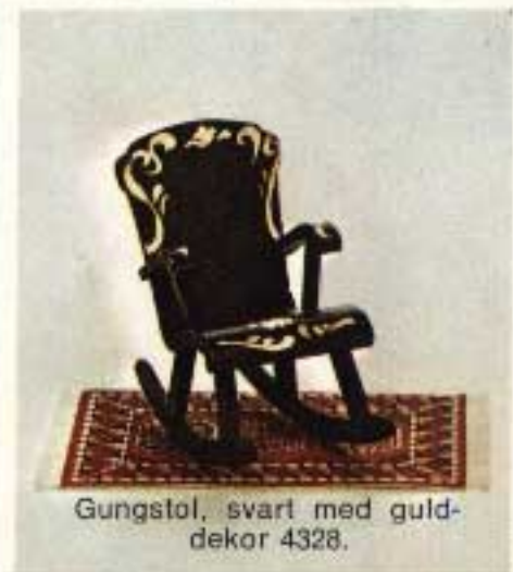
Gungstol, svart med gulddekor 4328.