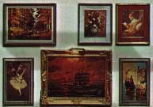
Exempel ur Lundby tavelsortiment: 4 Tavlor 6615. 4 Tavlor, varav en med belysning 6616.