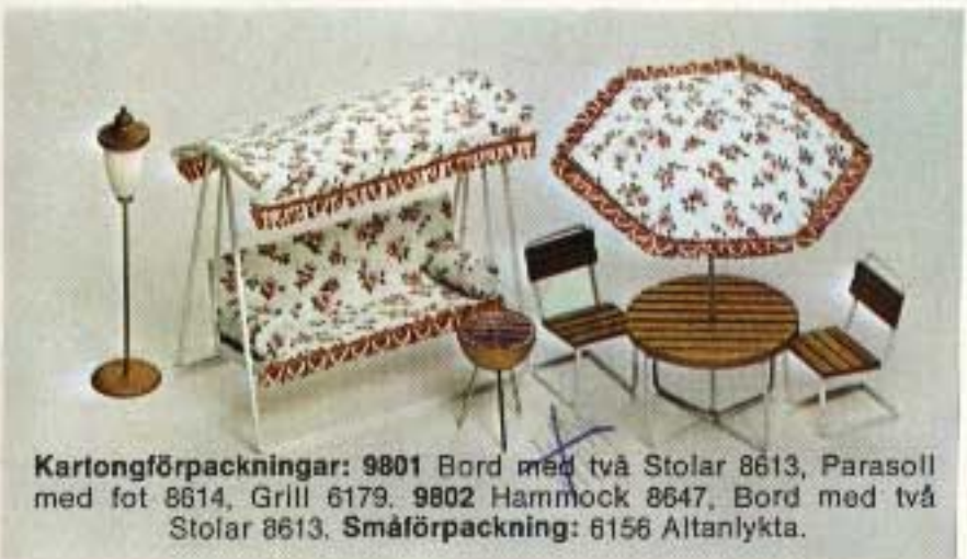
Kartongförpackningar: 9801 Bord med två Stolar 8613, Parasoll med fot 8614, Grill 6179. 9802 Hammock 8647, Bord med två Stolar 8613. Småförpackning: 6156 Altanlykta.