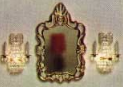
Småförpackning: 6643. Spegel 6853 och två kristall-lampetter 6143.