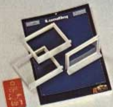
Sät med tre fönster 6301. Är avsedda att monteras i gamla Lundby-dockskåp.