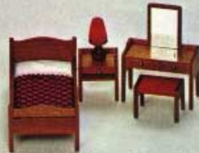
Enkelsäng, mahognylackerad bok 7262. Nattbord 7102. Lampa 6161. Toalettbord och Pall 7114.