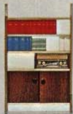
Bokskåp 8460. Radio 5492.