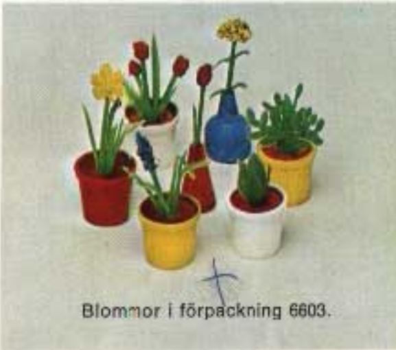
Blommor i förpackning 6603.