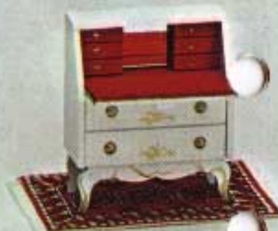
Sekretär med spegel och fällbar klaff 4316.

Kartongförpackningar: 9500 Tygklädd Soffa med stoppning 5210, två Fätöljer 5200, Soffbord mahogny 5250. 9502 Soffa 5210, Fätölj 5200, Bord 5111, öppen Spis med belysning 5773. 9403 Rokokobord och två Stolar 4313, två Stolar 4260. Moraklocka rokoko 4315, Byrå vit 4325. Småförpackningar: 6151 Golvlampa, 4318 Vit flygel med Pall, 6162 Bordslampa med rosa skärm.