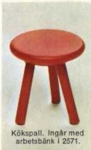
Kökspall. Ingår med arbetsbänk i 2571.