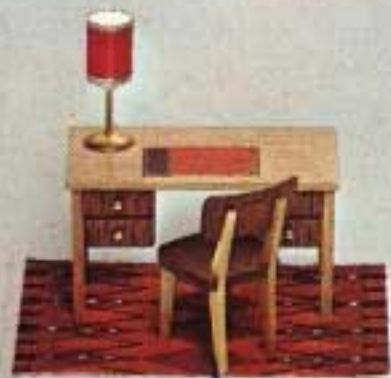
Skrivbord med Stol 5412. Bordslampa 6163.