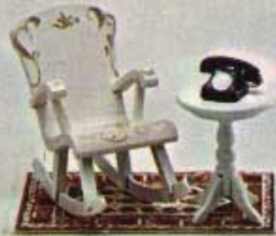
Gungstol 4327. Pelarbord 4113. Telefon 6840. Orientalisk matta 6222.