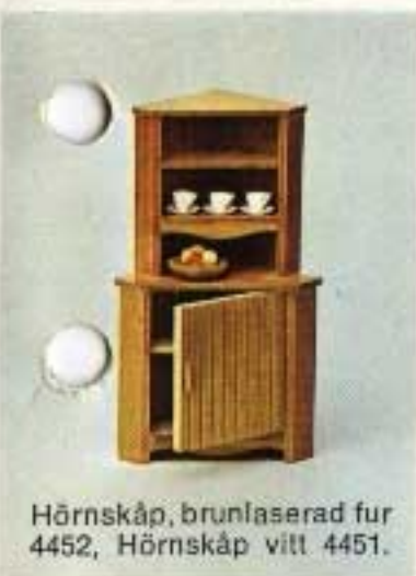
Hörnskåp, brunlaserad fur 4452, Hörnskåp vitt 4451.