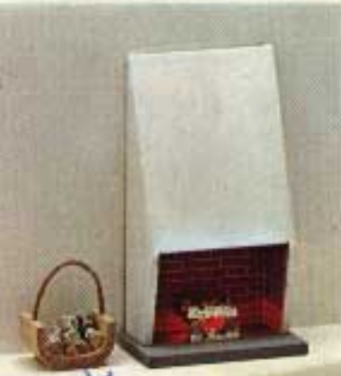
Öppen spis med lampa i brasan 5773. Vedkorg 5772.