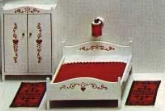
Säng med allmogedekor 7163. Klädskåp 7184. Matta "Balkan" 6233. Lampett 6173.