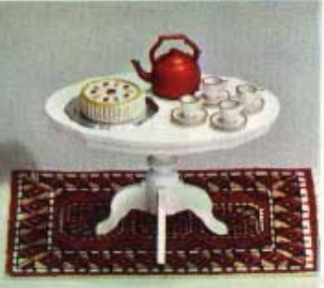
Soffbord, rokoko 4250. "Kaffe-rör" 6604.

Kartongförpackningar: 9770 Dubbelsäng rokoko 4321, Toalettbord med Pall 4323, två Nattbord 4324. 9710 Två bäddade vita Sängar 7263, två Nattbord 7103, Toalettbord med Pall 7115. 6171 Lampett gul.