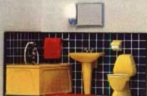
Kartongförpackning: 9880 Badrum. Enheterna finns även i styckförpackningar. Badrumsspegel med belysning 6850.

Kartongförpackningar: 9888 Badrum med mahognypanel, 9887 D.o. med lampetter, Enheterna finns även i tre småförpackningar: 8837 WC-stol, 8838 Tvättställ, 8839 Badkar, 8860 Bastu med lampa, furupanel.