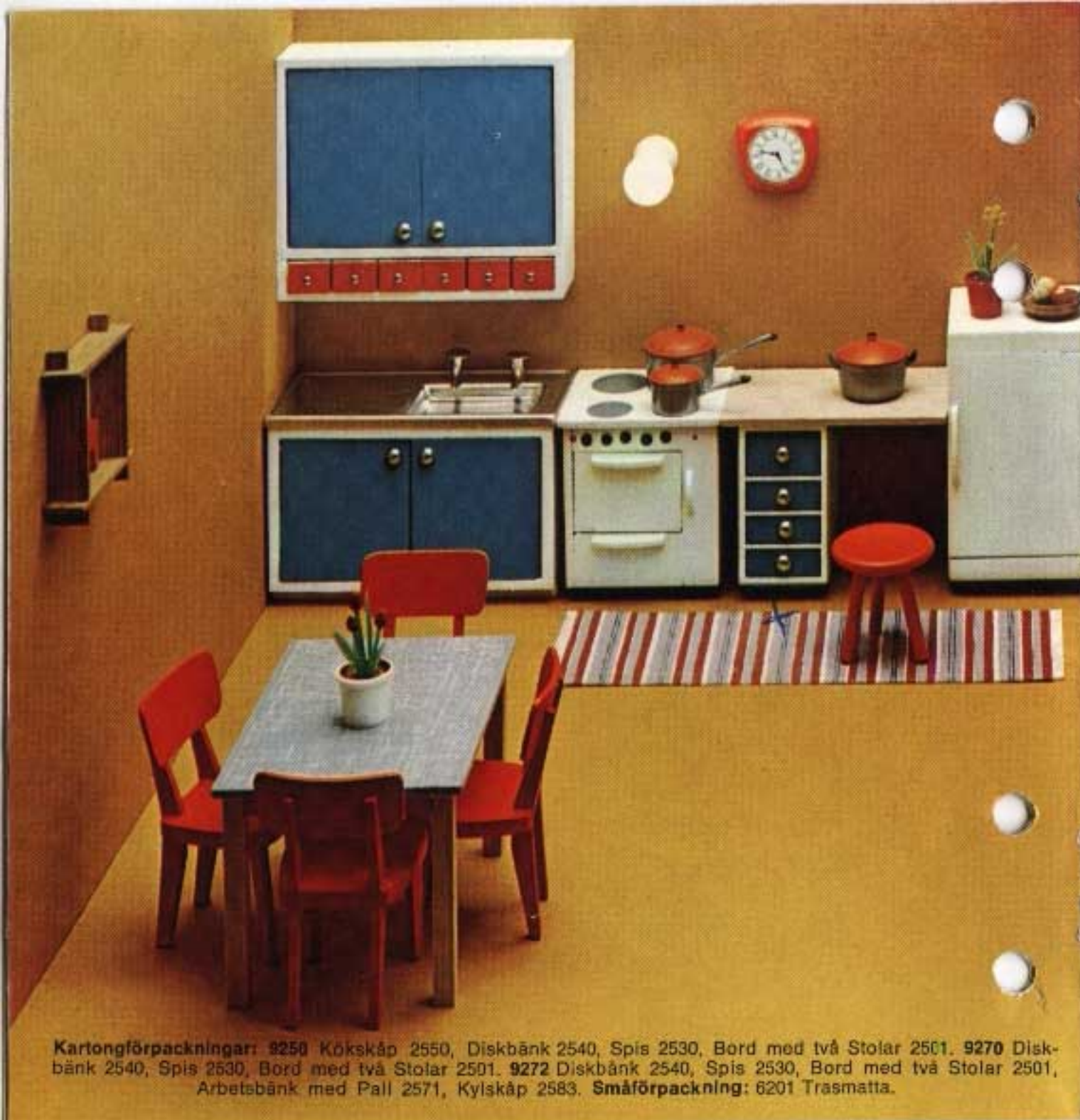
Kartongförpackningar: 9250 Kökskåp 2550, Diskbänk 2540, Spis 2530, Bord med två Stolar 2501. 9270 Diskbänk 2540, Spis 2530, Bord med två Stolar 2501. 9272 Diskbänk 2540, Spis 2530, Bord med två Stolar 2501, Arbetsbänk med Pall 2571, Kylskåp 2583. Småförpackning: 6201 Trasmatta.