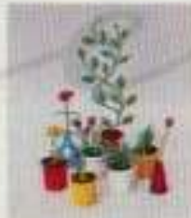
6603 8 blommor