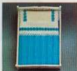
6402 Baddutrustning passande alla Lundby dubbeisängar. Finns även för enkelsängar, nr 6401