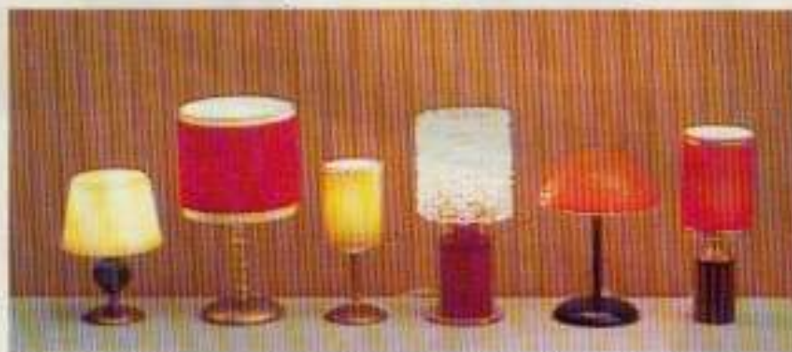
6162 Bordslampa glasfot, NYHET 6167 Bordslampa röd sammet lyx, 6163 Bordslampa gul siden, NYHET 6166 Bordslampa råkristall, 6165 Läslampa röd, 6164 Bordslampa räfflad mässing röd