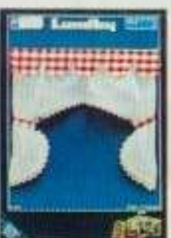
6330 Gardin Gille