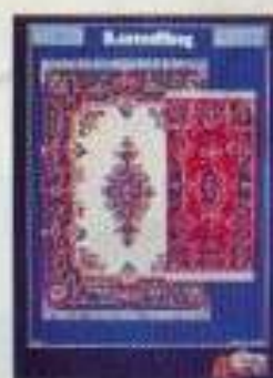
6284 Mattor Bagdad