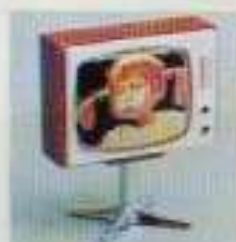
NYHET 5195 Färg-TV Pippi Långstrump