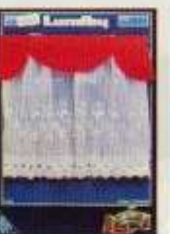
6340 Gardin Empire