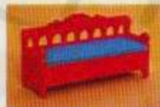
3140 Allmogesoffa, röd