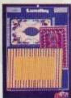
6282 Mattor Desirée