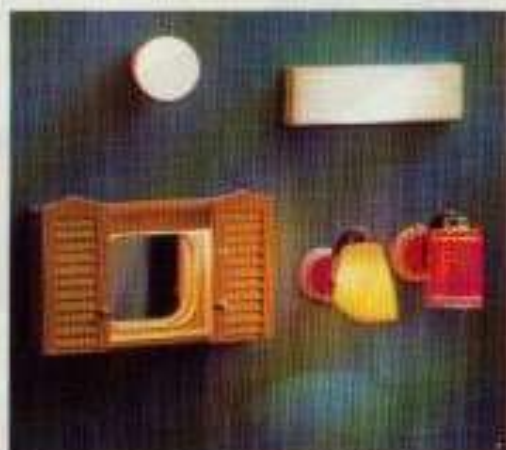
6121 Kökskupa 6123 Lysrör NYHET 8850 Badrumsskåp med lampa 6171 Lampett gul 6173 Lampett röd siden

Titta så många nyheter. Här finns tre nya bordslampor, fyra nya taklampor och tre nya golvlampor som du inte sett förut. Och så naturligtvis det nya tjugiga badrumsskåpet med inbyggd belysning.