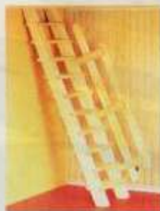
NYHET 6057 Trätrappa till bottenvåning