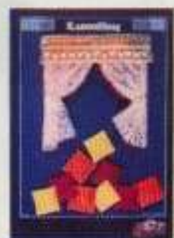
6350 Gardinsat, vardagsrum