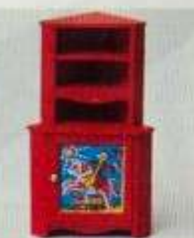
4454 Hörnskåp, rött