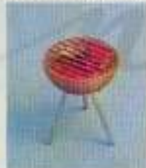
6179 Grill med "glödande kol"