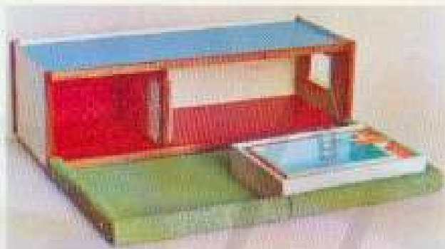
6050 Bottenvåning, 6054 Trädgård med swimmingpool