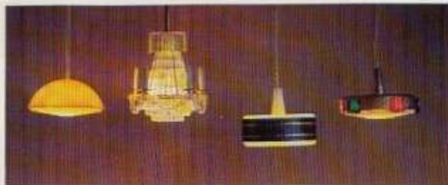
NYHET 6124 Taklampa gul, 6142 Kristallkrona, 6133 Taklampa vit/blå, NYHET 6136 Taklampa mässing m. prismor