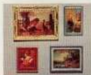
6615 4 tavlor 6616 4 tavlor, varav 1 med belysning