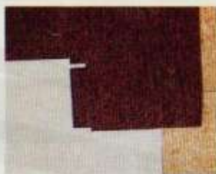
6286 4 heltäckningsmattor