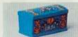
4400 Kista, blå