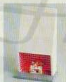
5773 Öppen spis med belysning