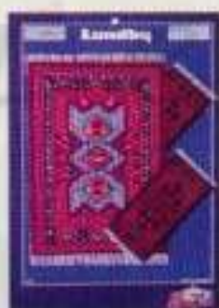
6283 Mattor Balkan