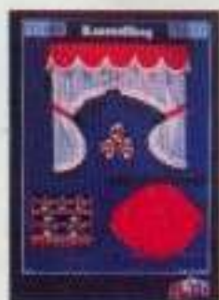
6320 Gardinsat kök