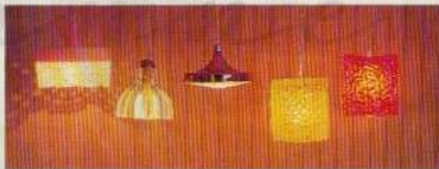
6177 Taklampa spets, 6144 Taklampa kristall, 6135 Taklampa koppar, NYHET 6134 Taklampa råkristall, gul eller orange