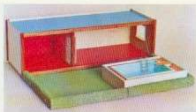
6050 Bottenvåning, 6054 Trädgård med swimmingpool