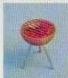
6179 Grill med "glödande kol"