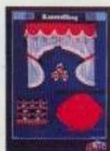
6320 Gardinset, kok