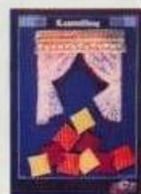
6350 Gardinset, vardagsrum