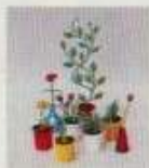
6603 8 blommor