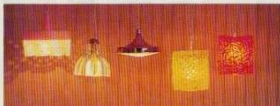
6177 Taklampa spets, 6144 Taklampa kristall, 6135 Taklampa koppar, NYHET 6134 Taklampa råkristall, gul eller orange