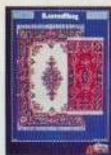
6284 Mattor Bagdad