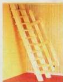
NYHET 6057 Trätappa till bottenvåning