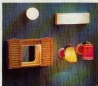
6121 Kökskupa 6123 Lysrör NYHET 8850 Badrumsskåp med lampa 6171 Lampett gul 6173 Lampett röd siden

Titta så många nyheter. Här finns tre nya bordslampor, fyra nya taklampor och tre nya golvlampor som du inte sett förut. Och så naturligtvis det nya tjusiga badrumsskåpet med inbyggd belysning.