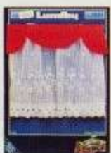
6340 Gardin Empire