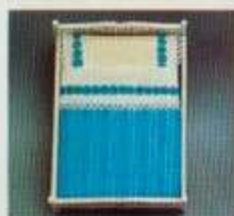
6402 Bäddutrustning passande alla Lundby dubbeisängar. Finns även för enkelsängar, nr 6401