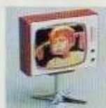
NYHET 5195 Färg-TV Pippi Långstrump