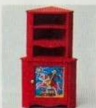
4454 Hörnskåp, rött