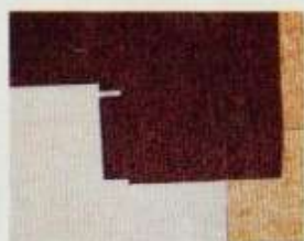
6286 4 heltäckningsmattor