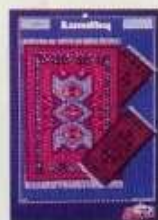
6283 Mattor Balkan