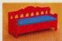
3140 Allmogesoffa, röd vit