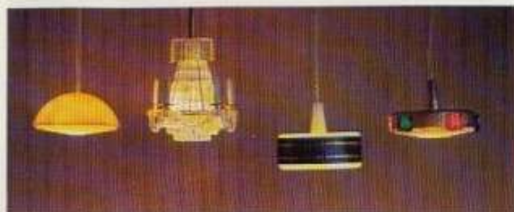
NYHET 6124 Taklampa gul, 6142 Kristallkrona, 6133 Taklampa vit/blå, NYHET 6136 Taklampa mässing m. prismor