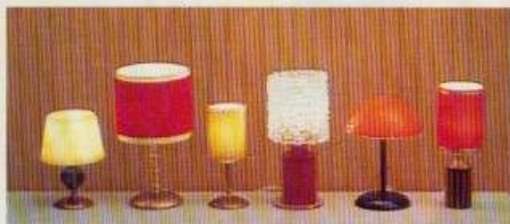
6162 Bordslampa glasfot, NYHET 6167 Bordslampa röd sammet lyx, 6163 Bordslampa gul siden, NYHET 6166 Bordslampa råkristall, 6165 Läslampa röd, 6164 Bordslampa räfflad mässing röd