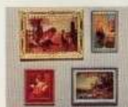
6615 4 tavlor 6616 4 tavlor, varav 1 med belysning