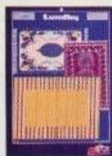
6282 Mattor Desirée