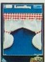
6330 Gardin Gille