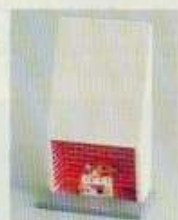
5773 Öppen spis med belysning